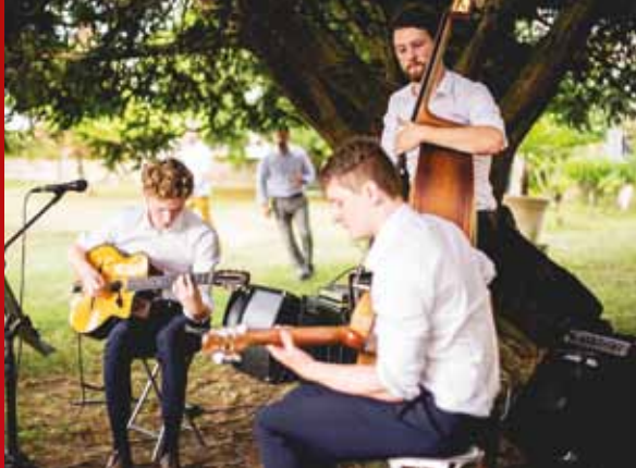
Les Triplets de Belleville