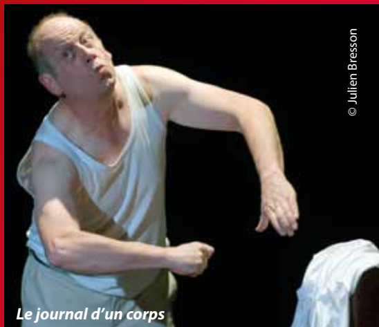
Le journal d'un corps