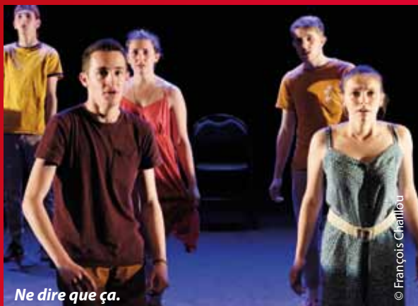
Ne dire que ça.