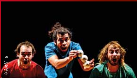
Piti Peta Hofen Show